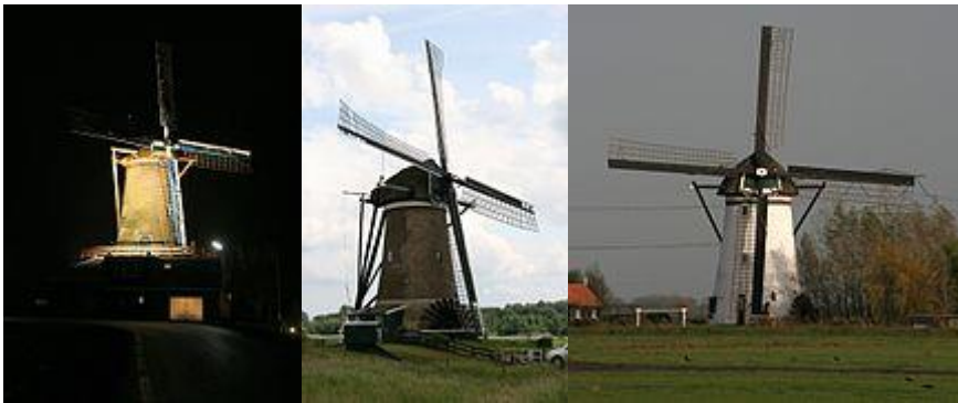
Molen De Hoop

In de Romeinse tijd vermoedt men een baanpost genaamd Tablis in de buurt van Oud-Alblas. Oud-Alblas telt 24 rijksmonumenten.